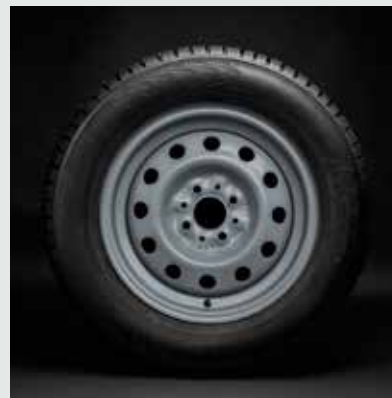
Диск штампованный серый R14