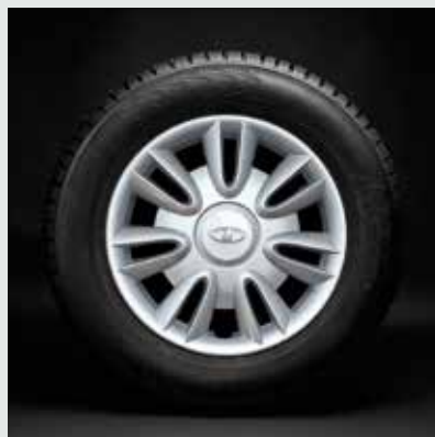
Колпак колеса «Калина» R14