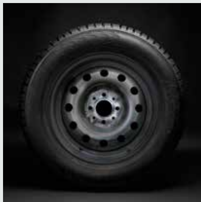
Диск штампованный R14

Классический подход к конструированию колеса, признанный большинством производителей во всем мире. Высокое качество сварных швов и покраски дисков LADA обеспечивает максимальную устойчивость к коррозии. Геометрия диска обеспечивает необходимый поток воздуха к тормозным механизмам автомобиля.