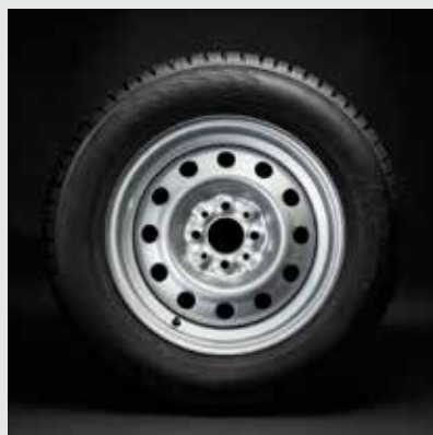
Диск штампованный серебристый R14