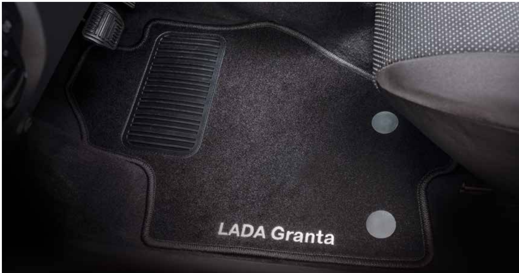
Ковры салона Original текстильные

Текстильные коврики изготовлены из износостойкого плотного материала. На ковриках передних ниш вытиснен белый логотип LADA Granta.