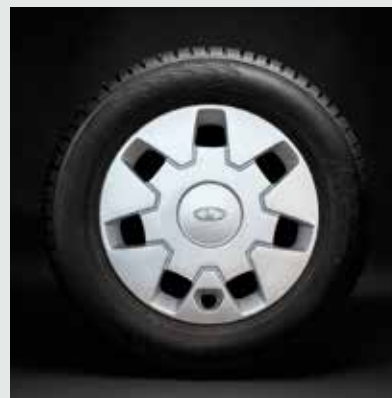
Колпак колеса «Калина» R14