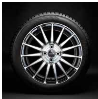
Sport 6.5j R16

Арт. 21910310101520 (диск) 21910310101420 (колпак)