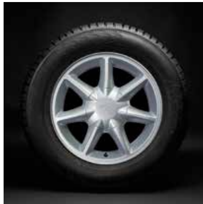
«Калина комби» R15

Арт. 21920310101510 (диск) 21920310101410 (колпак)