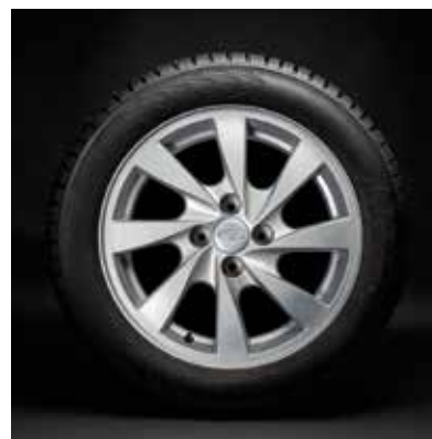
«Арин берд» R15

Арт. 21905310101577 (диск) 21905310101477 (колпак)