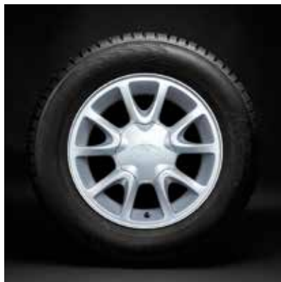
«Калина комби» R14

Арт. 21920310101510 (диск) 21920310101410 (колпак)