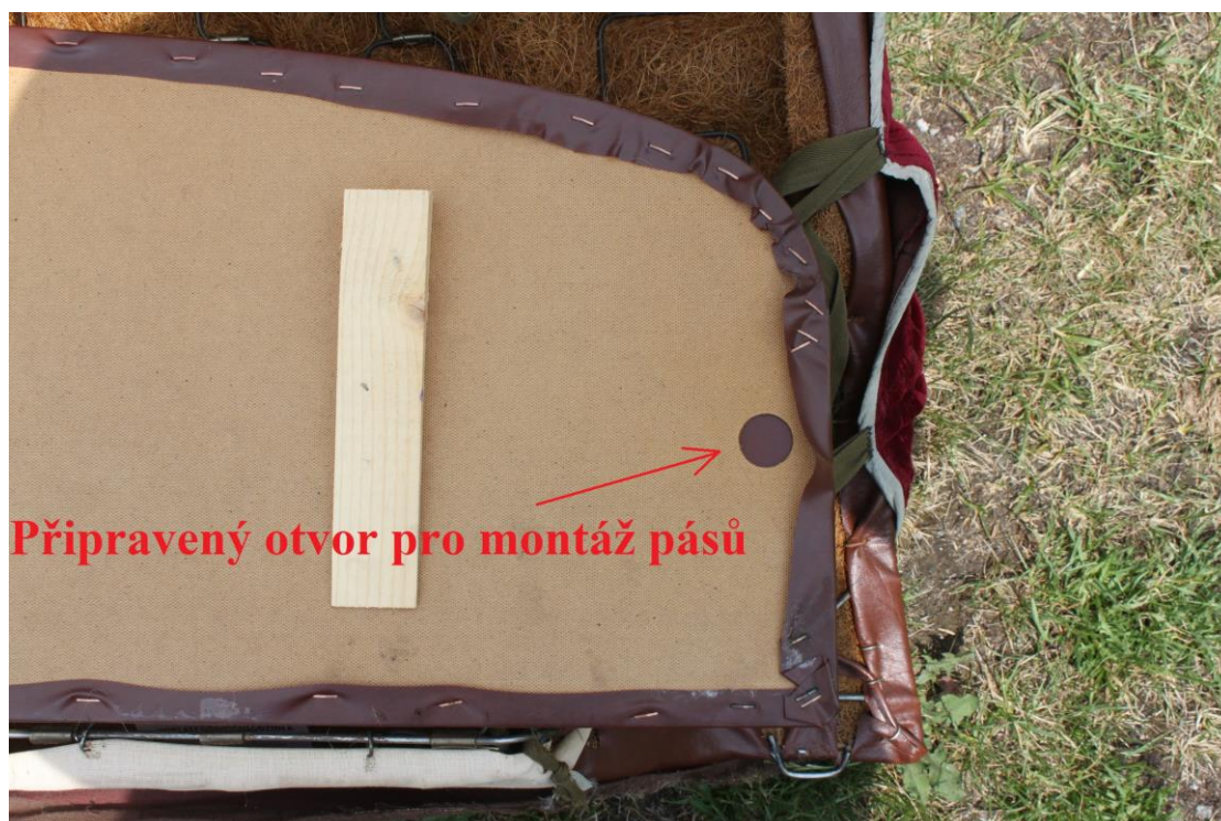
Zadní očalouněné plato, umístěné za zadním opěrákem – demontované z vozu.