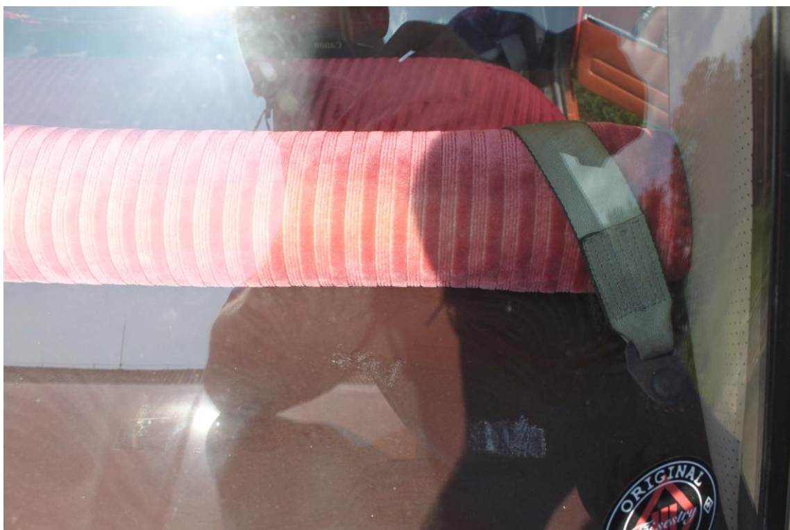
Prošroubováno přes plato, doporučuji delší šroub a pod plato jej podložit, aby se plato neprohnulo. Na hlavičku samozřejmě elegantní krytku.