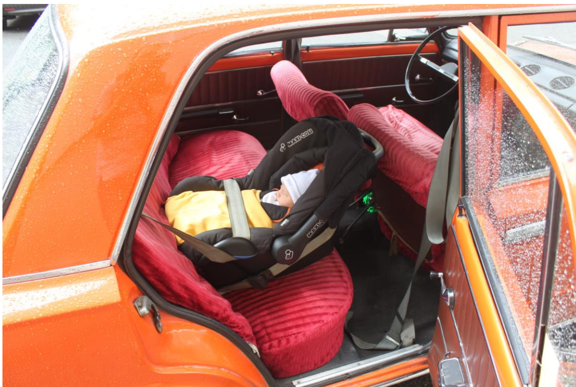
A takto vypadá spokojené miminko při cestě z porodnice 😊

Možná někteří z vás namítnou, že vozy Lada nejsou pro vození dětí bezpečné. Srovnávat je s dnešními moderními vozy, napěchovanými aktivní i pasivní bezpečností, samozřejmě nelze. Nutno však podotknout, že patří mezi ty bezpečnější veterány. Tuhá karoserie „Žigulíka“ zachránila život nejednomu pasažérovi.