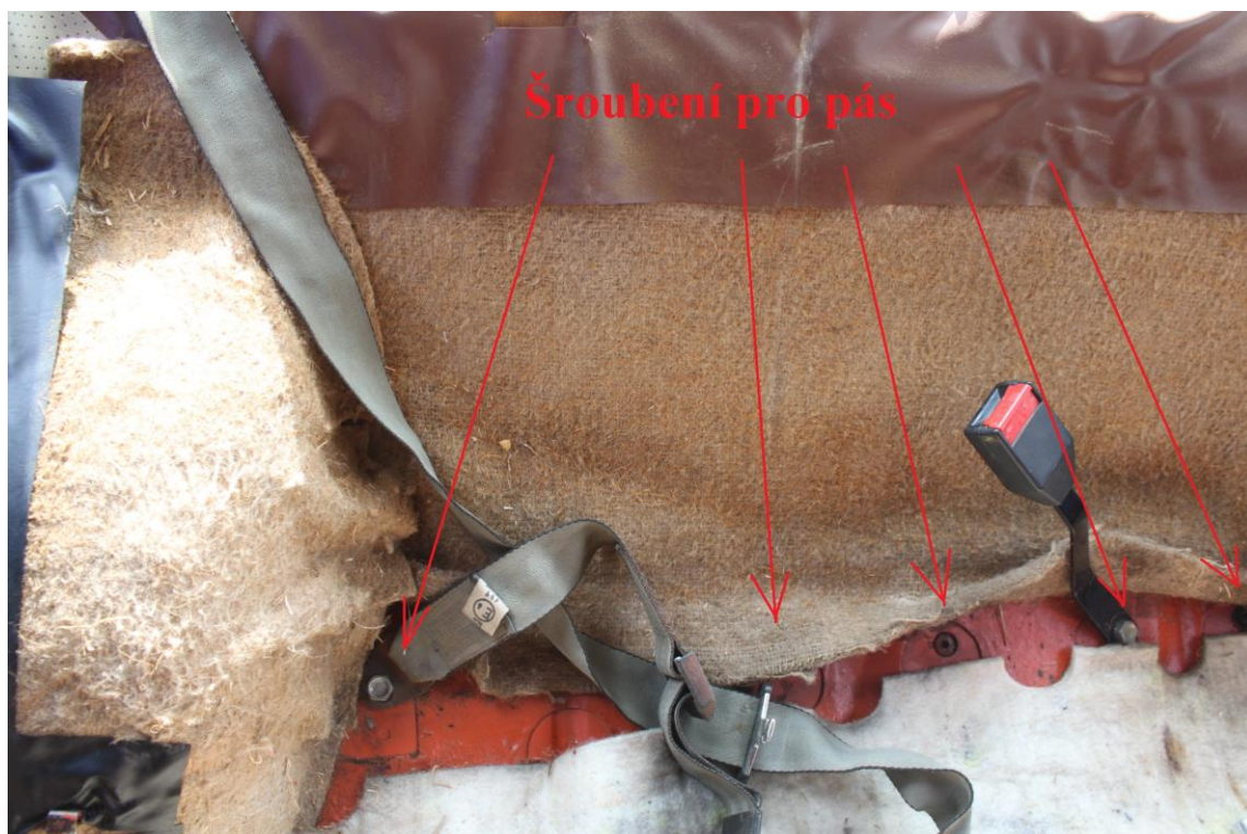
Otvorů pro uchycení pásů je vícero, lze si vybrat, všechny mají šroubení